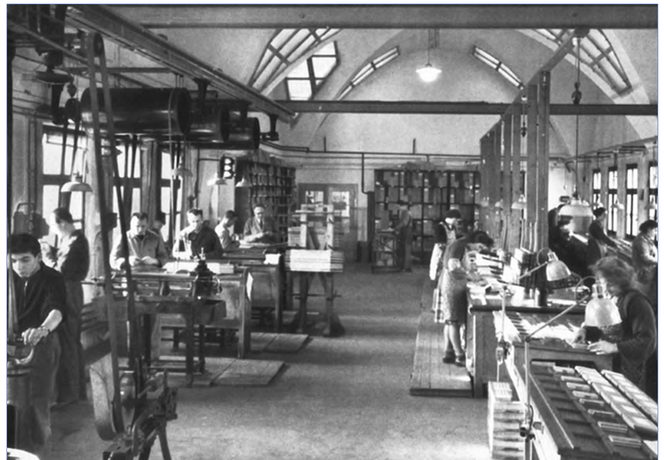
Einblick in die Haas'sche Schriftgiesserei, in welcher DropNet zuhause ist

Die bekannte Schriftenfirma Monotype bietet Ihre hochwertigen Schriften unter www.fonts.com/de an. Diese sind jedoch nicht lizenzfrei. Mit einem Abo erhält man Zugang zu vielen Tausend professionell gestalteten Schriften. DropNet AG