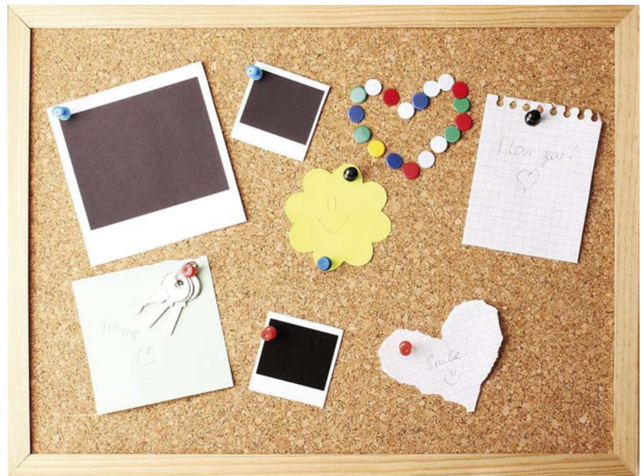
Nicht nur am Kühlschrank - auch im Web

DropPin macht einen Internet-Auftritt für die Mitglieder attraktiver, weil sie so in-