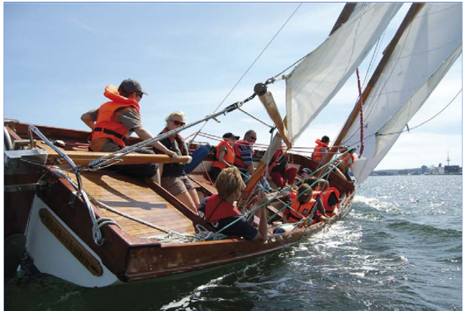
DropNet AG kümmert sich auch bei Sturm um Ihre Sicherheit

In den vergangenen Monaten haben sich wiederholt verschiedene einflussreiche Institutionen und Regierungen zum Thema Online-Sicherheit und verschlüsseltem Internet-Verkehr (auch "HTTPS") geäußert. Auch Browser-Hersteller Mozilla und Google beteiligten sich an der Diskussion und starteten verschiedene Initiativen zur Abschaffung von unverschlüsseltem Internet-Verkehr. Dabei wurde unter anderem bekannt, dass die Browser-Hersteller unverschlüsselten Internet-Verkehr in naher Zukunft nicht mehr unterstützen. DropNet AG beantwortet Ihnen die wichtigsten Fragen zu diesen Änderungen.